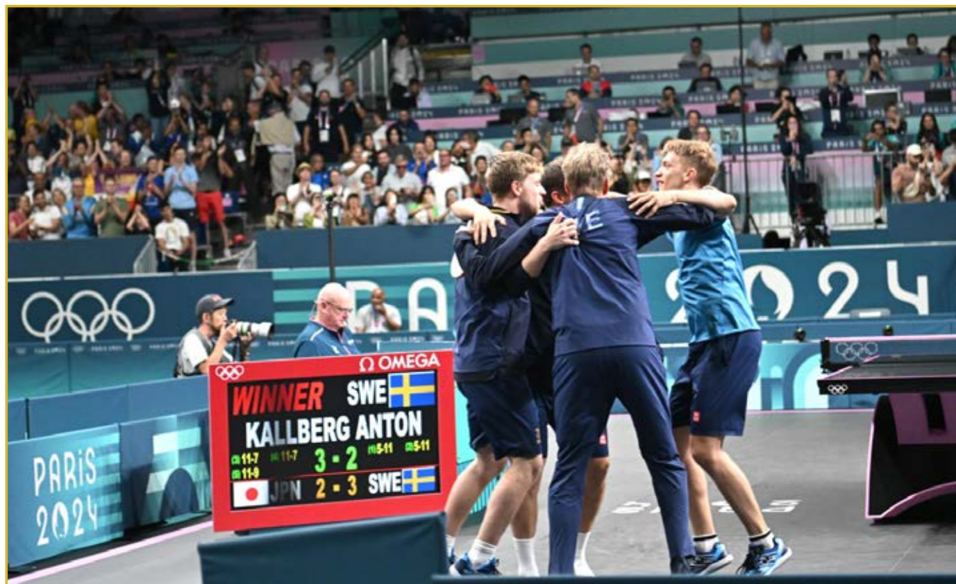
■ Ruotsi menestyi hienosti Pariisin olympialaisissa.