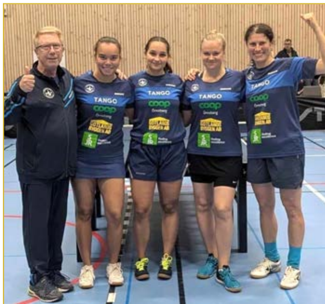
■ Spårvägens BTK.

Kesän toinen iso pöytätenniskilpailu oli veteraanien MM-kisat Roomassa. Kirjaimellisesti iso, ainakin osallistujamäärällä mitaten, sillä heitä oli yli 6 000 kuudelta eri mantereelta. Oli ilahduttavaa nähdä, kuinka "Rooma-kuume" levisi talven ja kevään aikana ja pelaajat, jotka eivät yleensä pelaa EM- tai MM-kisoissa, ilmoittautuivat mukaan. On hienoa tavata ja saada uusia pöytätennisystäviä ympäri maailmaa, ja kansainväliset ottelut motivoivat myös jokapäiväisistä arkeani. Lisäksi oli ilahduttavaa nähdä aikaisempaa enem-