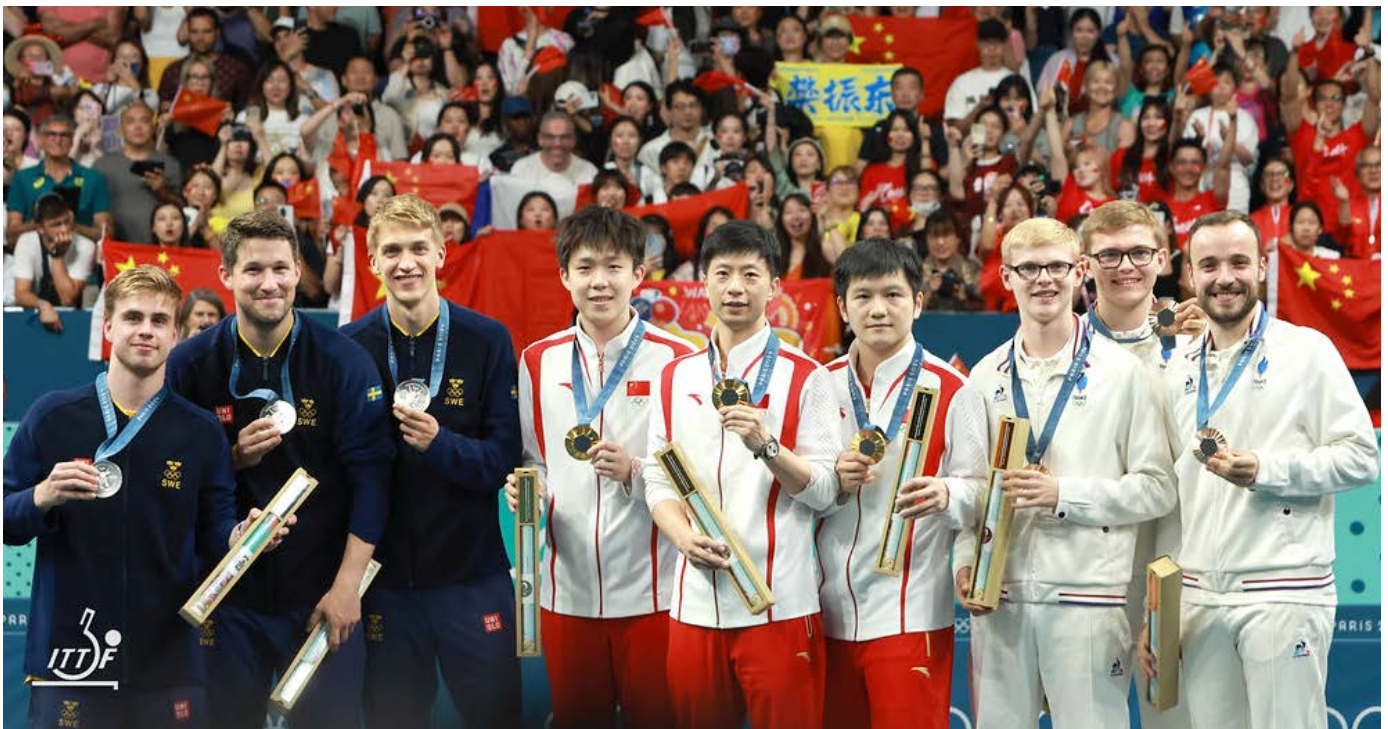
■ Miesten joukkuekisan mitalistit.

kaksinpelipronssin lisäksi Ranskan miehet juhlivat joukkuekissassa Japanin kustannuksella niin ikään kolmossijaa.