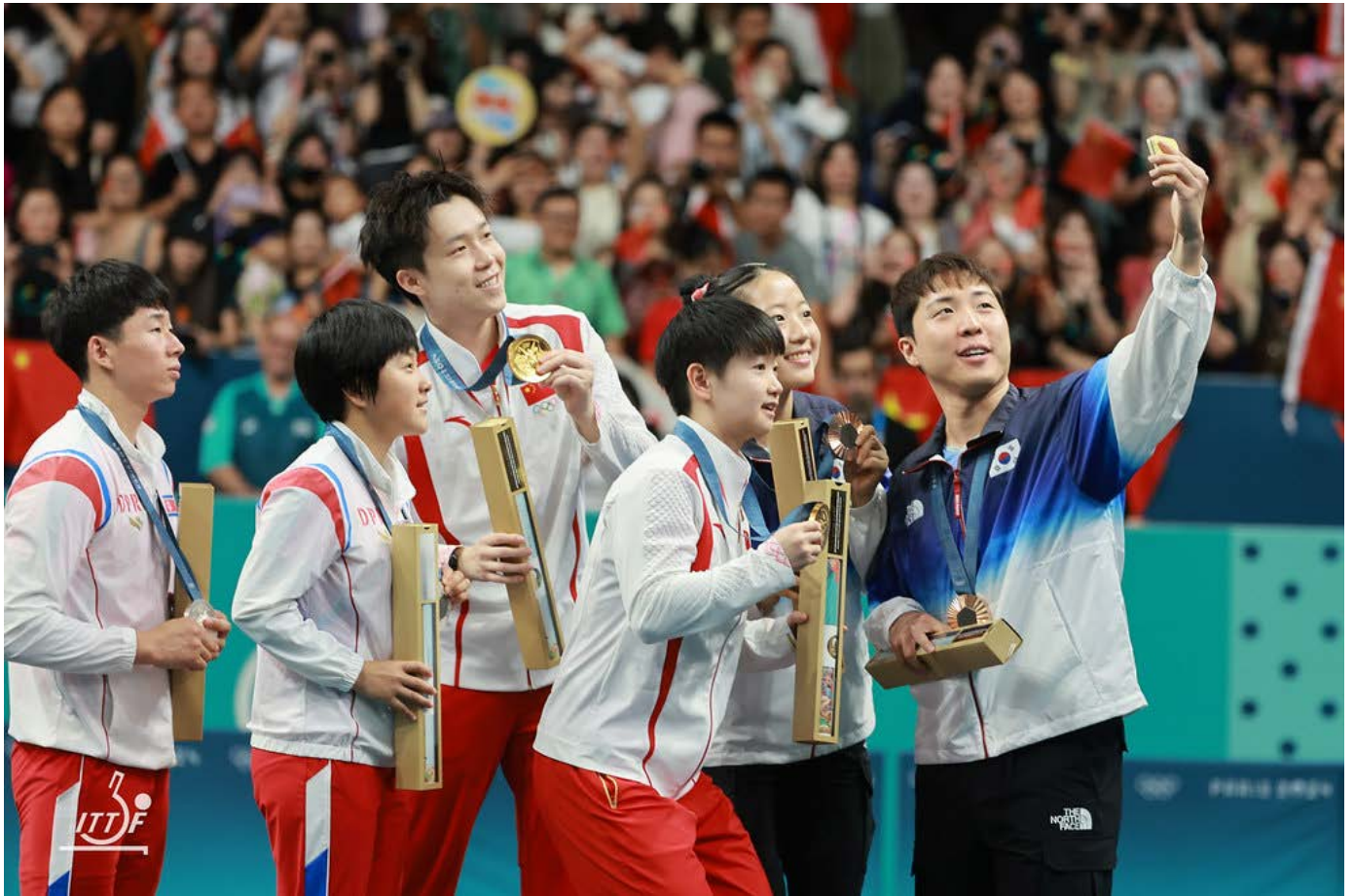
■ Harvinainen selfie sekanelinpelin palkintojenjaosta - molemmat Koreat sekä Kiina.