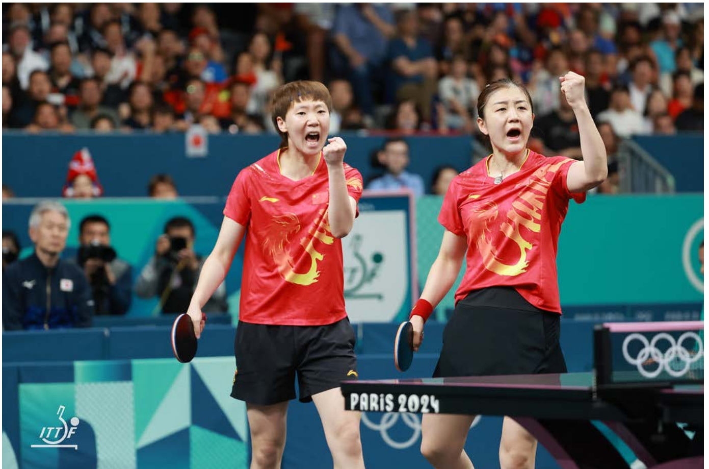
■ Kiinan naiset voittivat kaikki mahdolliset mitalit.