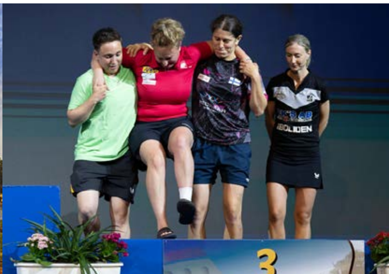
■ Pelikaveria ei jätetä pulaan.